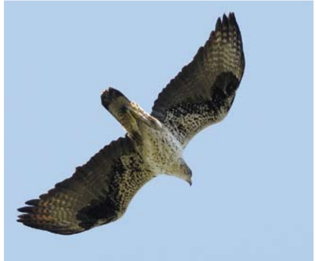
Photo 17 : Aigle de Bonelli Aquila fasciata femelle de 11 ans le 11 juin 2009