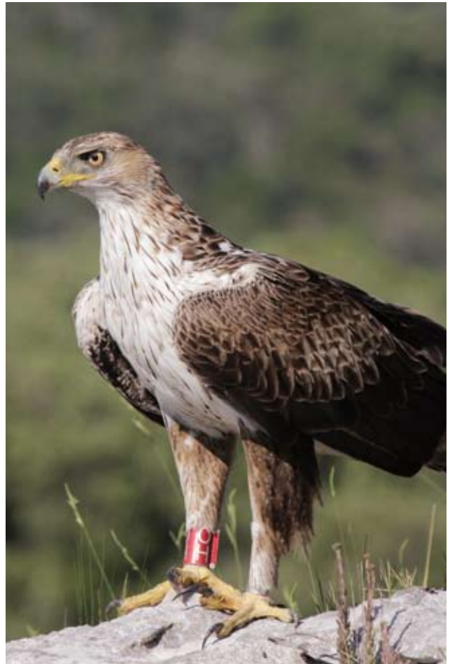
Photo 13 : Aigle de Bonelli Aquila fasciata femelle de cinq ans le 5 juin 2012 (© D. Lacaze). Des traces de roux subsistent sur quelques plumes de la poitrine Photo13: Fifth-year female Bonelli's Eagles Aquila fasciata , June 5 2012 (© D. Lacaze). Red feathers are still visible on the breast.