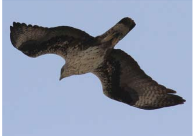
Photos 14 et 15 : A droite, Aigle de Bonelli Aquila fasciata mâle de six ans le 31 mars 2012 ; à gauche, femelle de sept ans le 26 mars 2012. Le mâle présente nettement deux stades de plumes sur les secondaires et probablement sur les primaires. Toutes les rémiges les plus internes sont récentes.