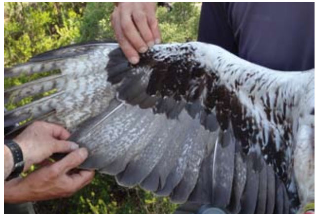
Photo 19 : Mâle de 19 ans le 29 mai 2012. L'aile s'éclaircit à nouveau grâce aux nombreux vermicules sur les rémiges. La barre noire du bord de fuite reste.