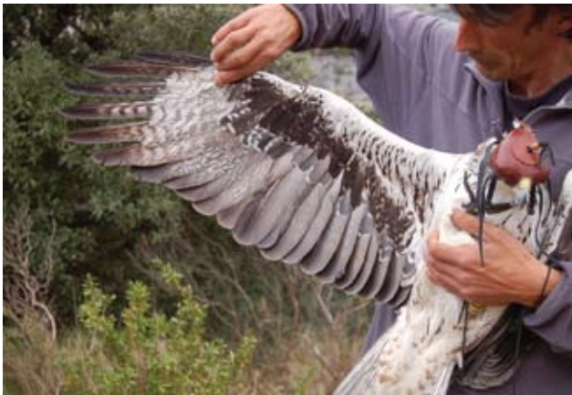
Photo 18 : Aigle de Bonelli Aquila fasciata mâle de 14 ans le 6 novembre 2009. A cet âge les vermicules sont très présents sur les primaires et apparaissent sur les secondaires.