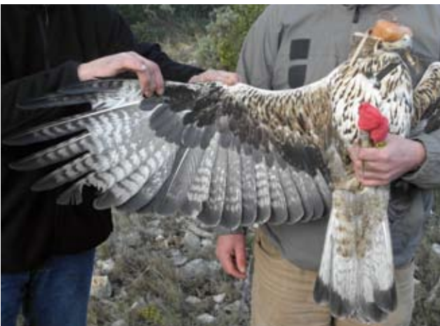
Photo 7 : Aigle de Bonelli Aquila fasciata femelle de quatre ans le 5 février 2013. On note la présence de marron-roux sur les plumes du ventre autour des flammèches centrales. Les couvertures sont encore nettement fauves. Toutes les rémiges sont de même génération sauf les P1 à P3 neuves. La différence de coloration et de taille des RS est nettement visible avec une S1 et S5 nettement plus claires et plus petites.

d'abord P1 vers l'extérieur, S13 vers l'extérieur, et S1 et S5 vers l'intérieur. Ces nouvelles plumes sont d'apparence plus sombre que la génération précédente, avec notamment les barres transversales noires qui s'élargissent. D'une mue à l'autre, les plumes s'assombrissent, mais, semble-t-il, aussi lors du même cycle de mue. Ainsi, dans le même cycle de mue, la dernière plume muée sera plus sombre que la première (photo 7).