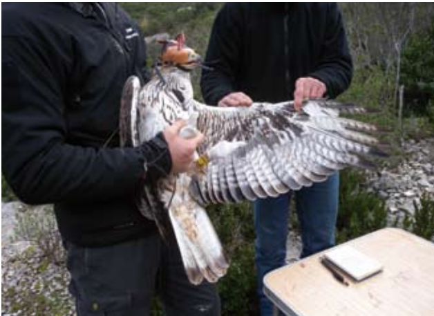
Photo 10 : Aigle de Bonelli Aquila fasciata mâle en fin de quatrième année, le 7 décembre 2011 (© N. Vincent-Martin). Il aura le même type de plumage en début de cinquième année. Les S1, S5, S6 et S7 sont neuves. Les P1 à P6 sont de même génération, mais les P1 et P2 sont déjà vieilles. Les P7 à P10, nettement usées, sont de la génération précédente. Photo 10: Fourth-year male Bonelli's Eagle Aquila fasciata , December 7 2011 (© N. Vincent-Martin). It will have the same feathering at the beginning of its fifth year. S1, S5, S6 and S7 are new. P1 to P6 are of the same generation, but P1 and P2 are already old. P7 to P10, clearly used, are of the previous generation.

Les couvertures sous-alaires présentent encore un fond de couleur chamois à blanc crème chez certains mâles alors qu'elles sont blanches chez d'autres et les femelles. La couleur des tectrices du ventre est nettement dominée par le blanc. Il faut un examen précis de ces plumes pour détecter encore des traces de marron-roux sur certaines d'entre elles (photo 13).