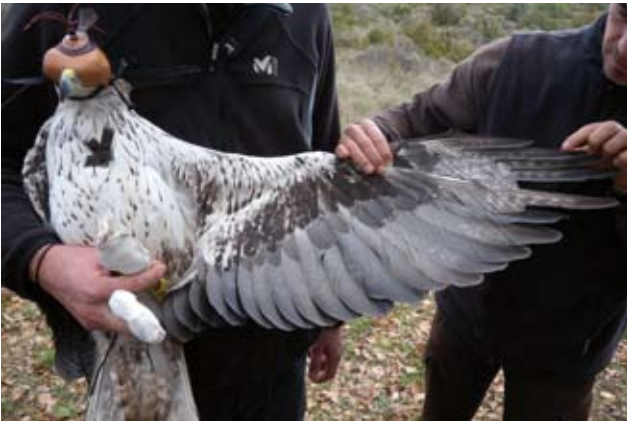
Photo 16 : Aigle de Bonelli Aquila fasciata femelle de 10 ans le 7 décembre 2011. Les rémiges sont quasiment entièrement sombres, gris ardoise, avec une barre de fuite large et plus foncée. Des vermicules apparaissent notamment sur les primaires. La mue semble plus complexe, ou s'agit-t-il simplement « d'accidents » ?