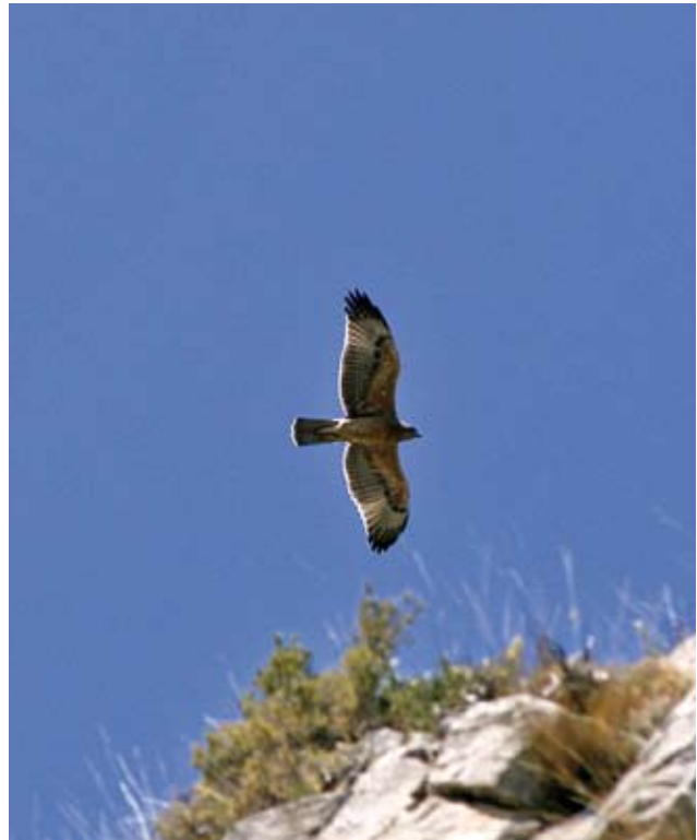
Photos 1 et 2 : Détails des ailes d'Aigles de Bonelli Aquila fasciata de un an, à gauche le 10 juillet 2011 (© J.C. Tempier), à droite le 25 juillet 2007 (© A. Flitti). Ils garderont ce plumage jusqu'au printemps suivant. Ces deux individus montrent une nette différence de coloration des grandes couvertures. Photos 1 and 2: Wing details of one-year Bonelli's Eagles Aquila fasciata , on the left, July 10 2011 (© J.C. Tempier), on the right July 25 2007 (© A. Flitti). They will keep this feathering till the following spring. Those two birds show clear differences in the coloration of the greater coverts.