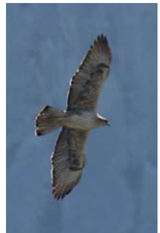
Photos 8 et 9 : Deux Aigles de Bonelli Aquila fasciata mâles de quatre ans, à droite le 3 mars 2013, à gauche le 8 avril 2011. Les rémiges sont toutes de la même génération, mais S1 et S5 sont plus courtes et plus claires car elles sont déjà anciennes. On distingue deux générations de rectrices de deuxième et troisième cycles de mue.