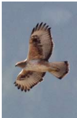
Photo 7: Fourth-year female Bonelli's Eagle Aquila fasciata , February 5 2013. Presence of brown-red feathers on the belly, around central sparks. Covers are still clearly fawn. All remiges are from the same generation except P1 to P3 that are new. Differences in coloration and size of the RS are clearly visible with S1 and S5 clearer and smaller.