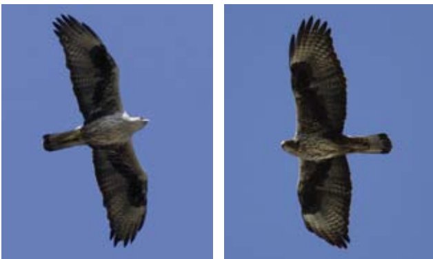
Photos 11 et 12 : Aigles de Bonelli Aquila fasciata de cinq ans, mâle à droite le 18 mars 2009 (© J.C. Tempier) et femelle à gauche le 7 mai 2012 (© M. Magnier). Les femelles sont généralement plus sombres que les mâles principalement sur les couvertures sous-alaires et les cuisses. On note deux zones plus sombres parmi les rémiges au centre des ailes, il s'agit de S1 et S5-6 nouvellement muées. Photos 11 and 12: Fifth-year Bonelli's Eagles Aquila fasciata , male on the right, March 18 2009 (© J.C. Tempier) and female on the left, May 7 2012 (© M. Magnier). Females are generally darker than males, mostly on the underwing coverts and the thighs. Notice two darker areas among the central remiges, the newly moulted S1 and S5-6